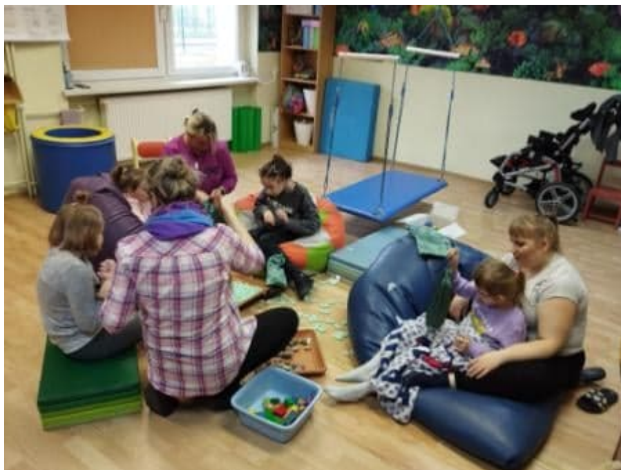
Ogólnopolski Projekt Edukacyjny „Gramy Zmysłami”