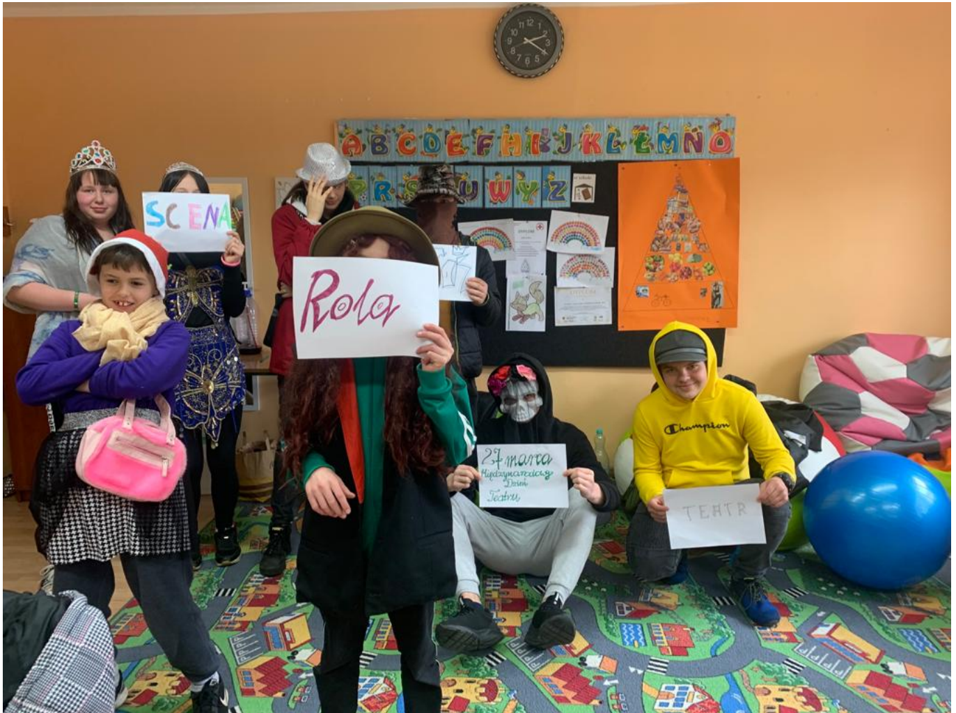
Światowy Dzień Teatru w SOSW Grodków

Międzynarodowy Dzień Teatru został zainicjowany w czerwcu 1961 roku podczas 9. Światowego Kongresu Międzynarodowego Instytutu Teatralnego w Helsinkach. Data święta upamiętnia otwarcie Teatru Narodów w Paryżu 27 marca 1957 roku.