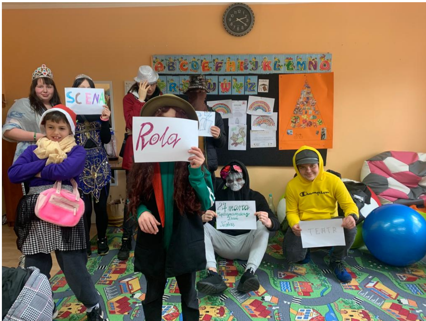
Światowy Dzień Teatru w SOSW Grodków

Międzynarodowy Dzień Teatru został zainicjowany w czerwcu 1961 roku podczas 9. Światowego Kongresu Międzynarodowego Instytutu Teatralnego w Helsinkach. Data święta upamiętnia otwarcie Teatru Narodów w Paryżu 27 marca 1957 roku.