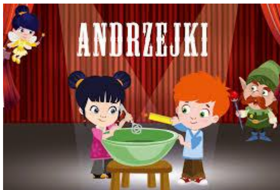
Andrzejkowe spotkanie integracyjne w świetlicy

„Andrzejki” Obchodzone w Polsce w noc z 29 na 30 listopada, w wigilię świętego Andrzeja. Tymczasem tradycja andrzejkowych wieczorów sięga zamierzchłych czasów. Pierwsze pisemne wzmianki o tym święcie pochodzą z XVI wieku. Warto dodać, że obrzędy z nimi związane daleko wykraczają poza znane nam lanie wosku i tańce.